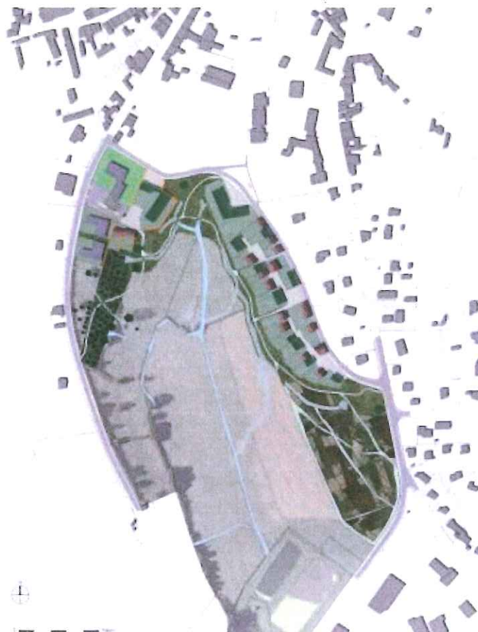
Plan Masse / Scénario 1 (juillet 2010) URBICAND

La zone dite « Les Ecorces » se dessine comme le secteur principal qui accueillera le développement de la commune tant d'un point de vue démographique qu'économique. Sa proximité avec les équipements collectifs situés dans le bourg est idéale pour accueillir certains équipements et aménagements publics supplémentaires et complémentaires. Ce futur quartier durable va ainsi se relier au reste de la commune en proposant d'une part une mixité dans l'offre de logements et d'autre part une extension de la zone artisanale et la création d'une zone de loisirs.