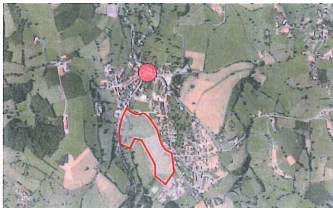
Photo aérienne de la commune

Depuis de nombreuses années, la municipalité de Tramayes fait partie de celles qui s'engagent volontairement dans le développement durable. Elle considère qu'il est plus que temps d'agir à toutes les échelles et sur tous les domaines pour proposer des aménagements innovants en adéquation avec les enjeux actuels. Elle compte déjà de nombreuses réalisations à son actif, dans différents domaines comme le chauffage, l'éclairage public, la collecte d'eau de pluie, la sensibilisation, etc. Ces réalisations démontrent que même les petites communes, bénéficiant de moyens financiers et humains limités, peuvent s'engager en faveur de l'environnement. Et la commune de Tramayes ne compte pas en rester là, le projet d'aménagement du quartier durable « Les Ecorces » s'inscrivant dans cette même optique