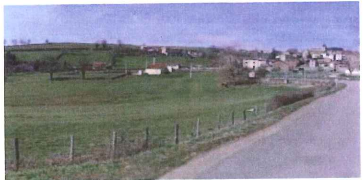
Photo du site de projet

Type de projet : Extension urbaine Situation : Proximité immédiate du centre-bourg État actuel : Terres agricoles Procédure : ZAC Superficie : 6,4 ha Logements : 63 Densité : 9,8 logements / ha Avancement : Études en cours Premières livraisons en 2025